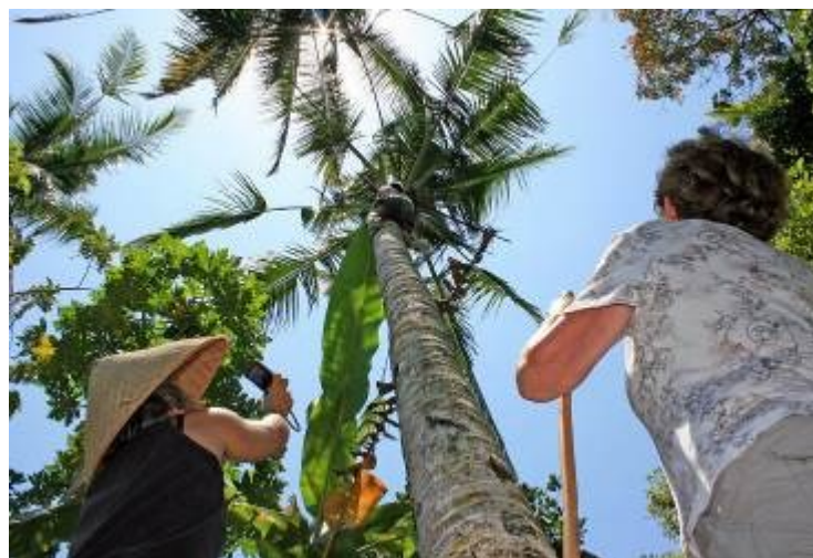
Gambar 7. Tropical Plantation