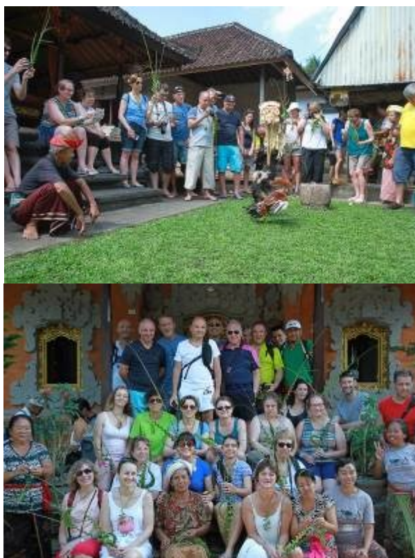
Gambar 2. Kunjungan Wisatawan Mancanegara

Banjar Beng Kaja Desa Tunjuk merupakan wilayah dari Kecamatan Tabanan, Kabupaten Tabanan Bali. Menuju Desa Tunjuk dapat ditempuh sekitar 45 menit dari Kota Denpasar atau sekitar 25 km. Desa Tunjuk merupakan hamparan dataran dengan pemanfaatan lahan berupa lahan persawahan 236, 25 ha/m 2 , lahan pemukiman 70, 28 ha/m 2 , lahan kering atau ladang 142, 23 ha/m 2 , dan Agrowisata 175 ha/m 2 .