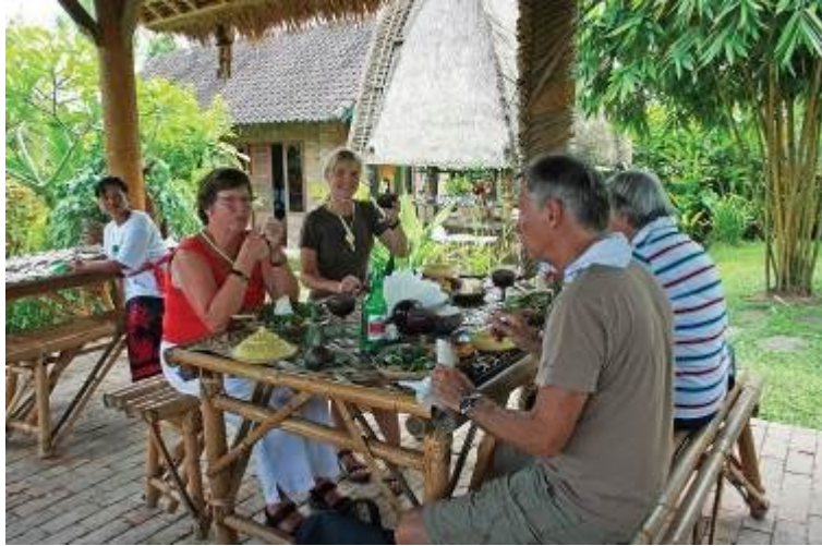
Gambar 8. Lunch