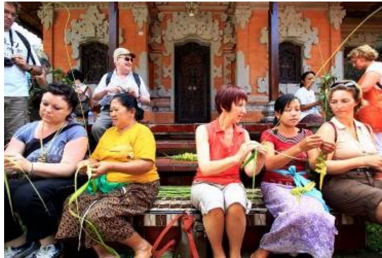
Gambar 5. Praktik di Traditional House