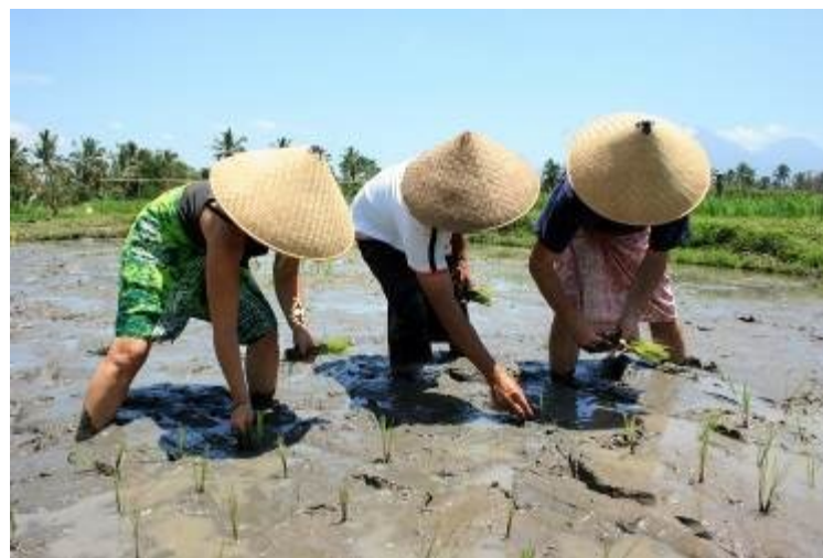
Gambar 6. Traditional Farming