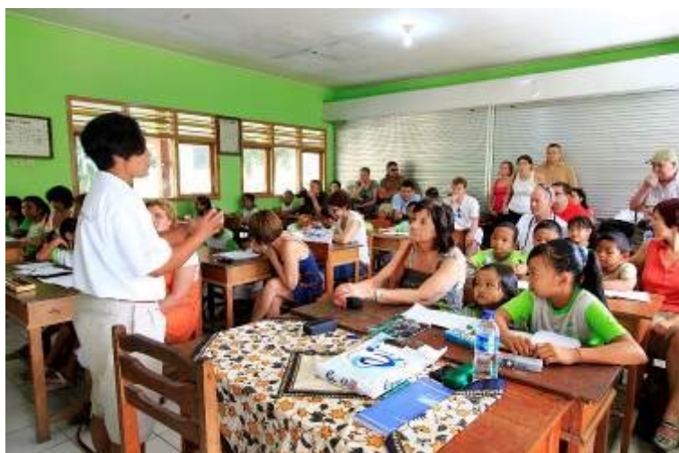
Gambar 4. School Visit