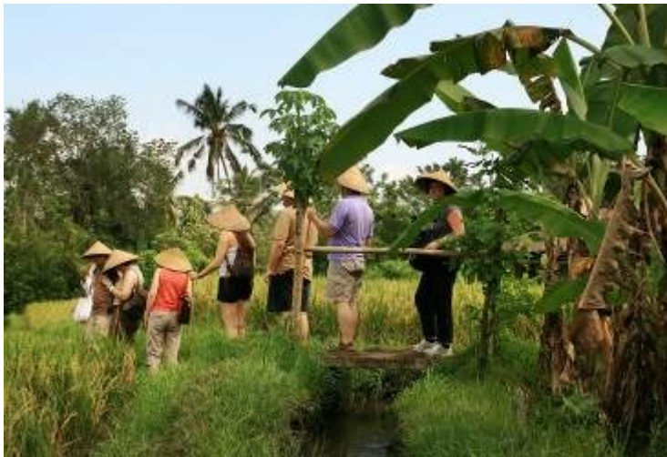
Gambar 3. Village Life and Farming

disuguhkan menu makan siang lebih dahulu sebelum melaksanakan kegiatan ini. Rute diawali berjalan melewati lahan persawahan masyarakat sekaligus mempelajari tentang pertanian tradisional pada segi proses, peralatan dan sistem subak . Dilanjutkan mengunjungi lahan perkebunan masyarakat melihat tanaman-tanaman tropis, mengunjungi bendungan desa setempat, kuburan tradisional, perumahan tradisional masyarakat dan kembali ke home base . Sedangkan kegiatan Village and Farming dimulai pada pagi hari. Kegiatan ini mengajak para wisatawan melihat dan berinteraksi langsung dengan kegiatan-kegiatan di beberapa titik seperti interaksi dengan siswa sekolah dasar, rumah keluarga tradisional dengan aktifitas tradisional, kegiatan di persawahan, perkebunan buah tropis dan rempah-rempah, dan diakhiri dengan makan siang.