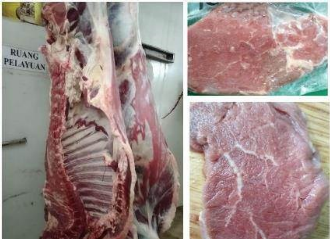
Gambar 1. Karkas dan daging sapi bali hasil penelitian.

Sifat fisik karkas yang meliputi pH, daya ikat air dan susut masak tidak menunjukkan perbedaan yang nyata antara sapi yang mendapat tambahan tepung jagung dengan sapi yang tidak mendapat tambahan tepung jagung (Tabel 2). Susut masak daging sapi pada penelitian ini, berkisar antara 33,27 – 35,49. Ada kecenderungan terjadi penurunan susut masak dengan meningkatnya pemberian tepung jagung. Penelitian Komariah et al. (2009) yang meneliti kualitas daging sapi Brahman, kerbau dan domba mendapatkan bahwa susut masak daging sapi 6 jam setelah dipotong adalah 41,40%. Hasil penelitian ini mendapatkan bahwa kualitas daging sapi hasil penelitian ini lebih baik, karena mempunyai susut masak yang lebih kecil. Obuz et al. (2004) menyatakan bahwa meningkatnya susut masak erat kaitannya dengan serat otot dan penyusutan kolagen. Di samping itu, susut masak erat kaitannya dengan daya ikat air, semakin rendah daya ikat air, maka susut