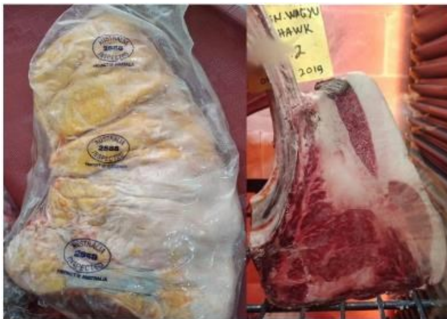
Gambar 2. Karkas daging sapi impor

Hasil penelitian ini mendapatkan bahwa meningkatnya pemberian tepung jagung menyebabkan kecenderungan meningkatnya daya ikat air dan menurunnya susut masak (Tabel 2). Hal ini memberikan indikasi bahwa pemberian tepung jagung pada sapi penggemukan dapat meningkatkan kualitas fisik daging sapi. Kurniawan (2014) dalam penelitiannya mendapatkan bahwa daya ikat air daging sapi 23,67–33,98%. Perbedaan daya ikat air ini dipengaruhi oleh beberapa faktor antara lain: perbedaan breed sapi, umur sapi, tingkat stress, pakan yang diberikan dan pH. Semakin tinggi pH maka daya ikat airnya juga cenderung meningkat. Penurunan pH akan menyebabkan denaturasi dari protein daging sehingga menurunkan kelarutan protein yang selanjutnya menurunkan daya ikat air.