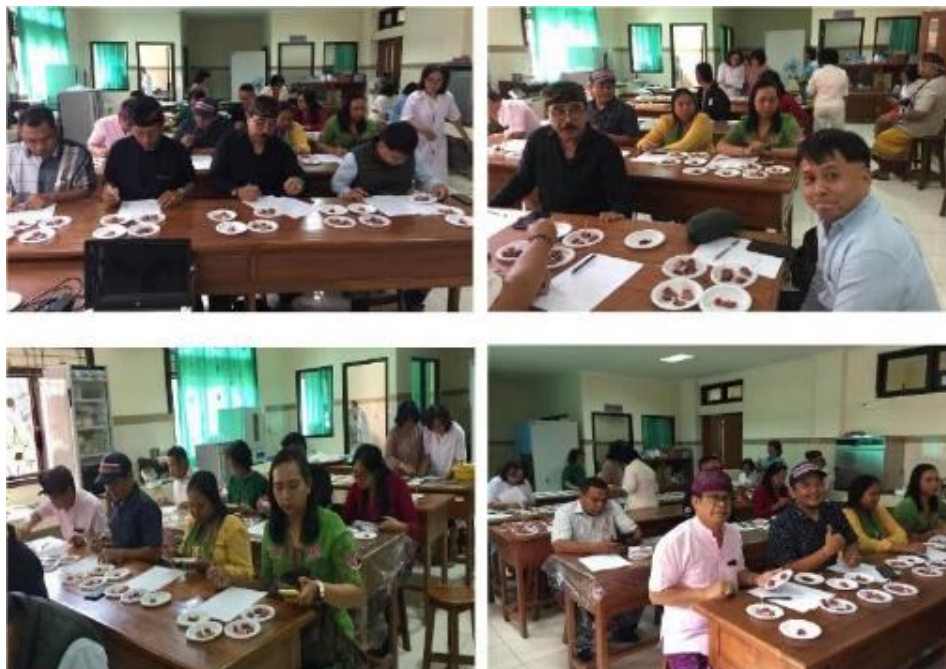
Gambar 3. Pelaksanaan Test Organoleptik di Lab. Mikrobiologi Fapet Unud.

Uji organoleptik dilaksanakan dengan mengundang sekitar 25 orang panelis yang berasal dari: RPH, ahli daging, ilmuwan, chef , praktisi, masyarakat umum, dan praktisi. Skor yang dipakai adalah 1 sampai dengan 10. Semakin tinggi nilai skor, maka semakin baik penerimaan responden. Pada Tabel 3 tampak bahwa warna daging sapi hasil penelitian lebih disukai dari pada daging sapi import maupun daging sapi lokal. Terhadap test aroma, daging sapi bali penelitian ini lebih disukai dibanding daging sapi import akan tetapi mempunyai angka kesukaan yang sedikit lebih rendah dibandingkan daging sapi bali lokal yang dibeli di pasar tradisional. Keempukan dan citarasa daging sapi bali hasil penelitian ini menunjukkan nilai yang lebih tinggi dibandingkan daging sapi import maupun sapi lokal.